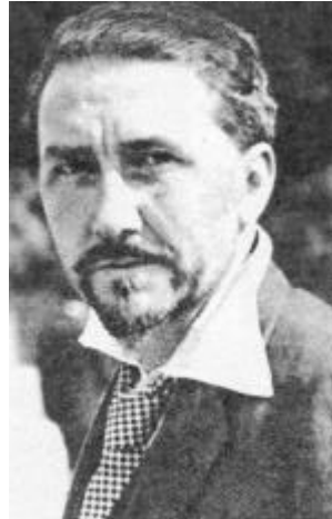
Ezra Pound, le 1er décembre 1935

Je n'ai pas, cependant, choisi la ligne de Lindbergh, je la considère comme erronée. La